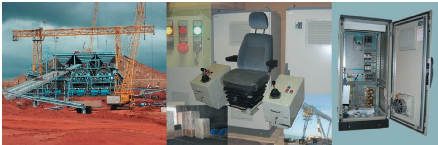
Рис. 2. Частотный электропривод с модулем рекуперации был успешно применён при реконструкции электрооборудования козлового крана ККС32 в горнорудном обществе «Катока» в Анголе